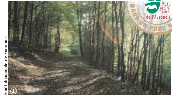
Forêt domaniale de Fourmies.

Randonnée Pédestre Circuit du Camp de Giblou : 9 ou 12 km