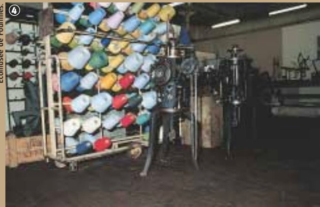
Ecomusée de Fourmies.

trie textile, le fleuron économique du XIX e siècle. Cette union de l'Homme et de la Nature a forgé l'identité du territoire, en témoigne le musée du Textile et de la Vie sociale de Fourmies, antenne de l'Ecomusée de la région de Fourmies-Trélon en Avesnois.