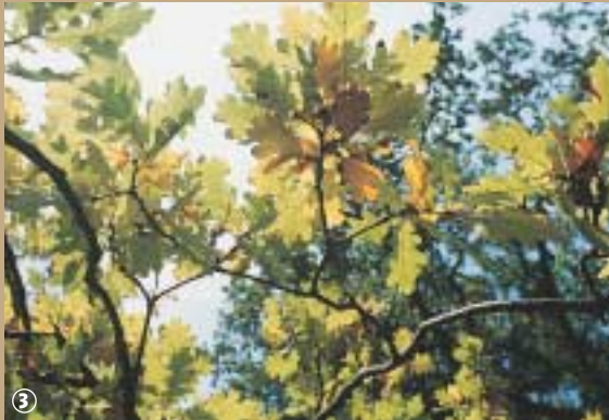
Chêne, forêt domaniale de Fourmies.

Aujourd'hui, la paix retrouvée, la forêt est devenue un véritable espace de détente et de loisirs. Chaque balade se révèle une expédition dans le monde merveilleux des arbres. Ce lieu est aussi une invitation à l'histoire économique et sociale de la ville de Fourmies. Le bois fut en effet, une matière première largement utilisée, notamment dans l'industrie métallurgique, mais aussi dans l'indus-